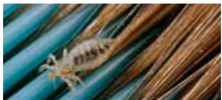
Hoofdluis op een kam.